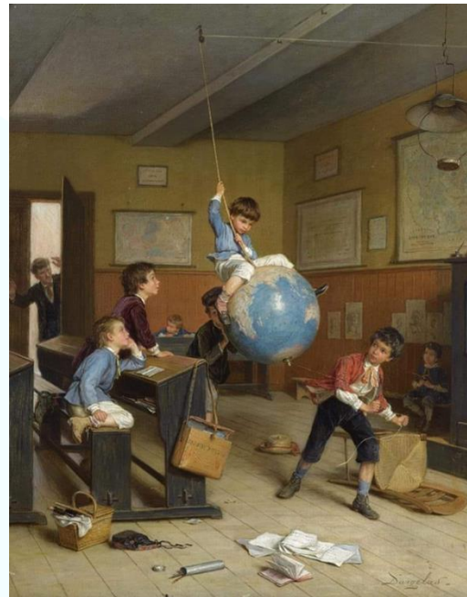
Даргелас А.А. Кругосветное путешествие

Изменяющаяся среда формирует новые запросы: учитель должен обладать умениями, необходимыми для адресной работы с различными категориями учащихся, и это не только одаренные дети, но и дети, попавшие в трудные жизненные ситуации, дети с особыми образовательными потребностями (аутисты, дети с синдромом дефицита внимания и гиперактивностью), с девиациями поведения.