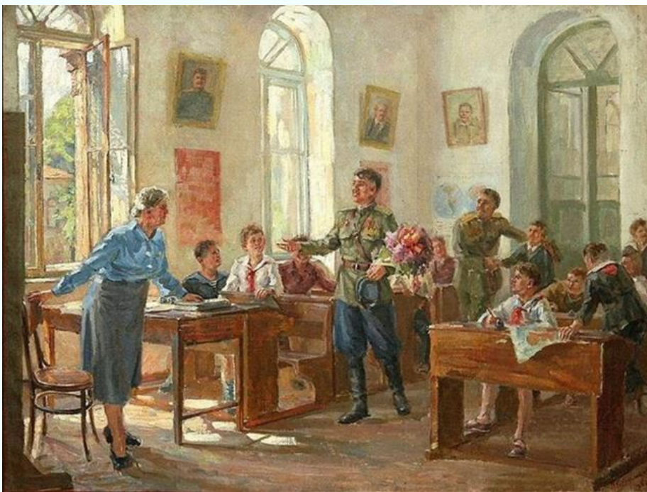
Терентьев О. Герои в школе