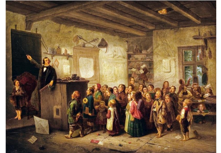
Газенклевер И.П. Сельская школа